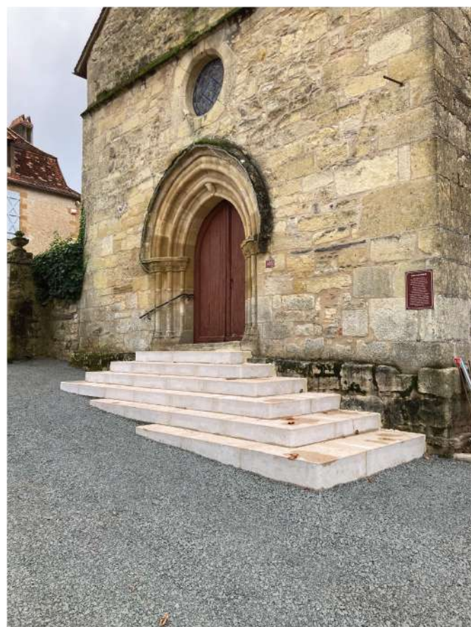
St Médard d'Excideuil - Travaux d'embellissement du bourg.