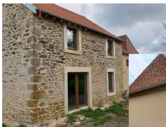
AVANCÉE DES TRAVAUX DE LA MAISON BEYNEIX À DUSSAC

A Dussac, les 2 T3 de la Maison "Beyneix" située à la sortie du bourg, seront disponibles en juin 2024.