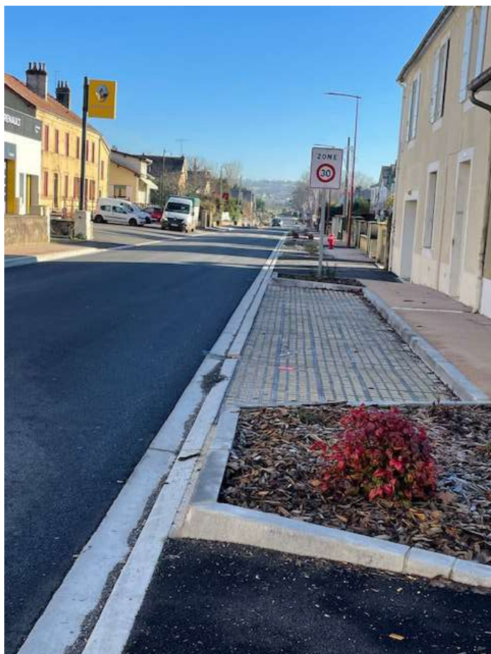
Avenue E. Leroy à Excideuil.

Travaux CCILAP/commune : 104 194,75 € HT, Subvention FNADT : 36 468,16 €, Subvention Département : 24 021,34 €, Bureau d'Etudes SOCAMA, Entreprise SNPTP.