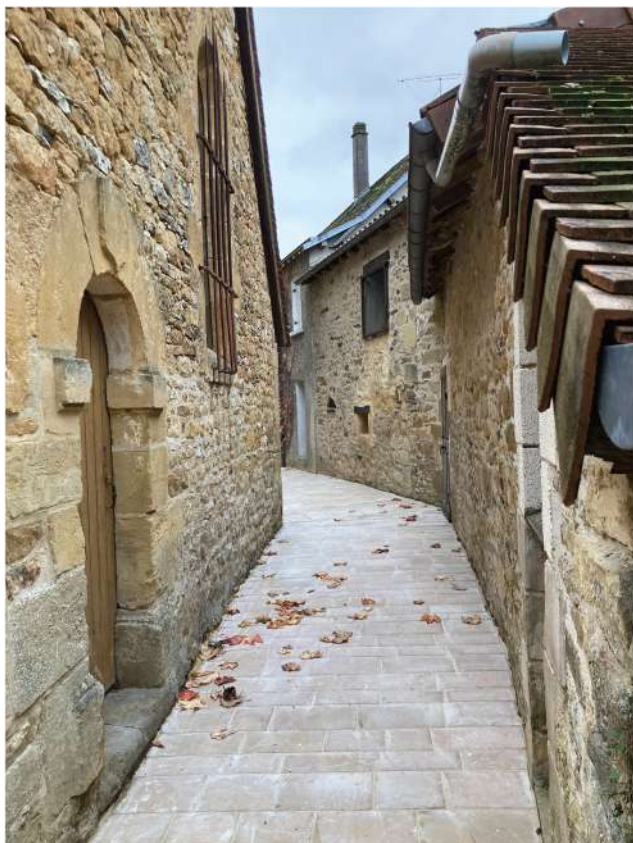
St Médard d'Excideuil - Travaux d'embellissement du bourg.

Les travaux d'embellissement du bourg sont en cours.