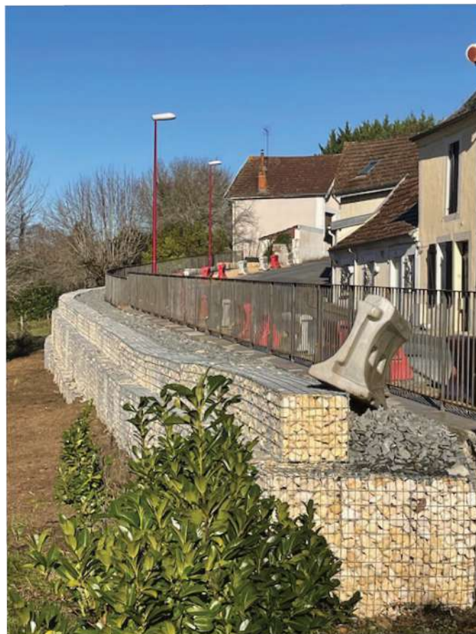
Réfection du mur de soutènement Bvd Jean Rebière.