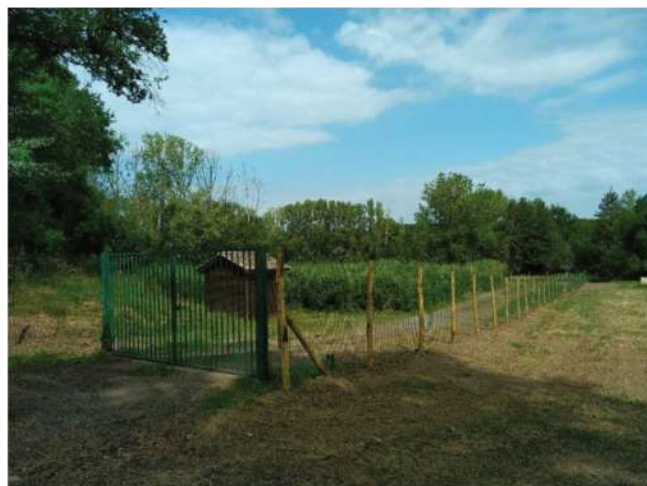
La STEP de Cherveix-Cubas.

Montant prévisionnel : 34 036,59 € HT, (financement CCILAP 35,36% - Agence de l'Eau 30% et fonds de concours de la commune : 34,64 %).