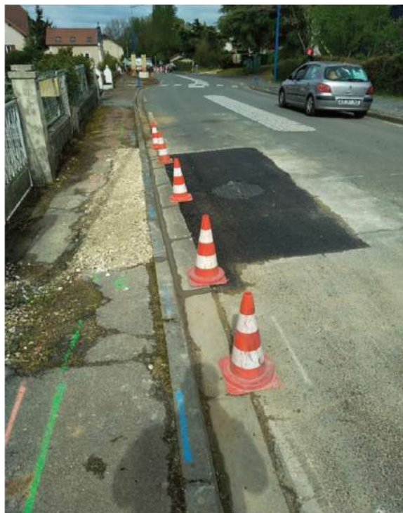
Reprise des réseaux sur la commune de Coulaures.

Au Poste de Relevage de La Borie : la reprise du refoulement, du regard d'entrée du poste et de l'entrée sur le réseau principal est prévue, tout comme la création d'une dalle béton et la réfection de la clôture. Montant prévisionnel des travaux : 4 325,60 € HT.